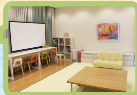
託児実施部屋 (MUSCAT CUBE 2 階 医療人支援室)