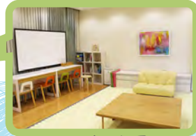
託児実施部屋 (MUSCAT CUBE 2 階 医療人支援室)