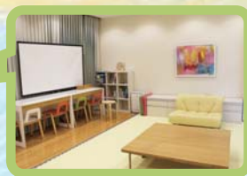
託児実施部屋 (MUSCAT CUBE 2階 医療人支援室)