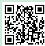
参加申込フォーム